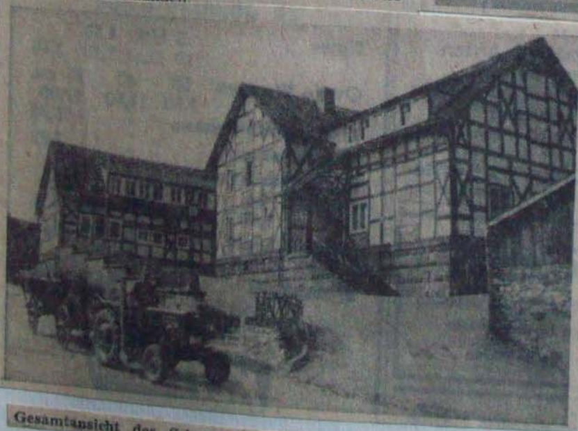
Gesamtansicht des Schul-Landheims in Berndorf.

Im Hintergrund der Berndorfer Kirchturm.